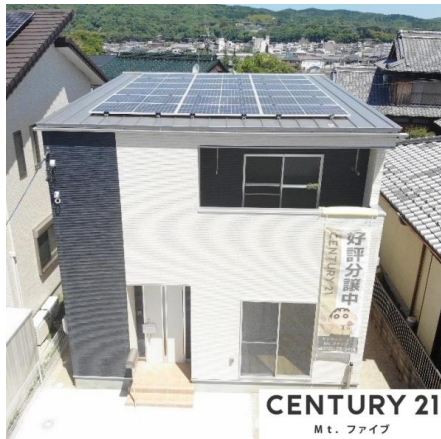
CENTURY 21 Mt. ファイブ